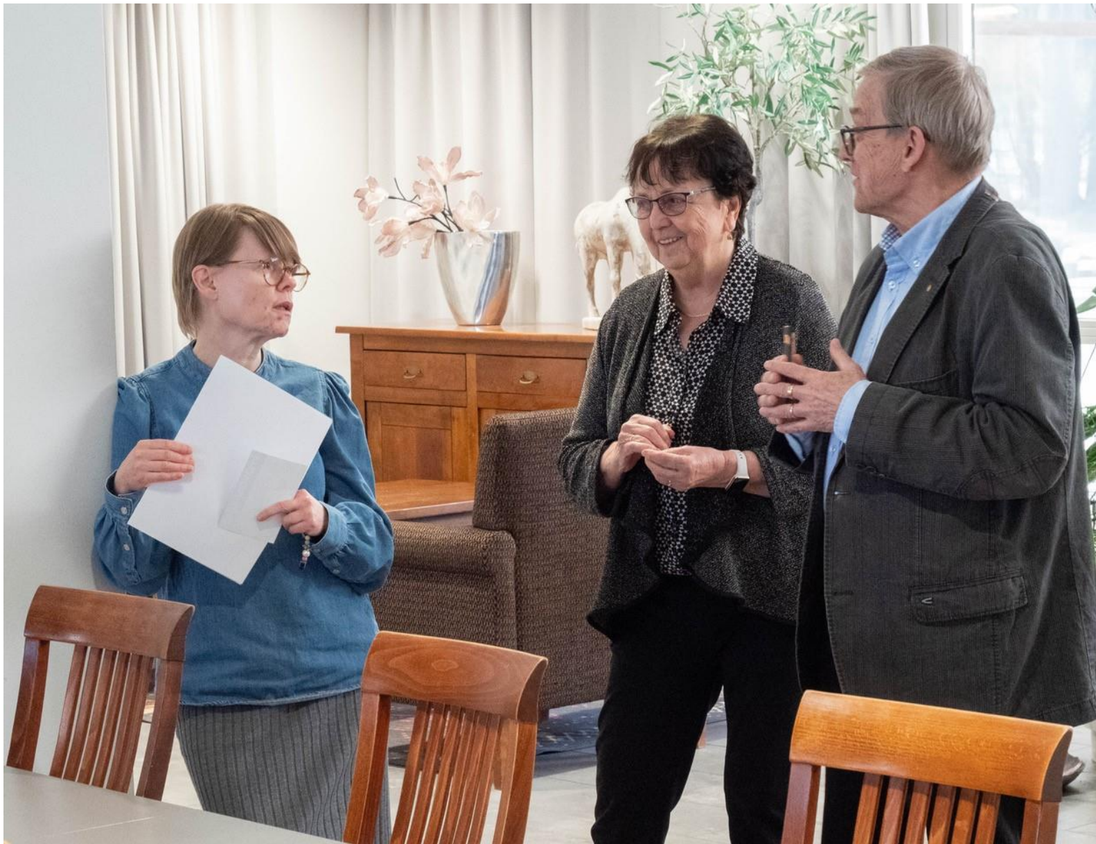
Esittelyn aikana kokoustan ohi sattui kulkemaan Haapavedeltä lähtöisin oleva henkilö, joka pysähtyi kiinnostuneena kuuntelemaan esittelyä.