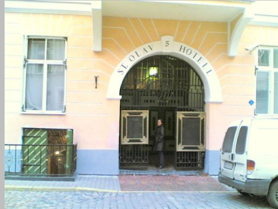
Hotelli St. Olav, sisäänkäynti, Lai 5