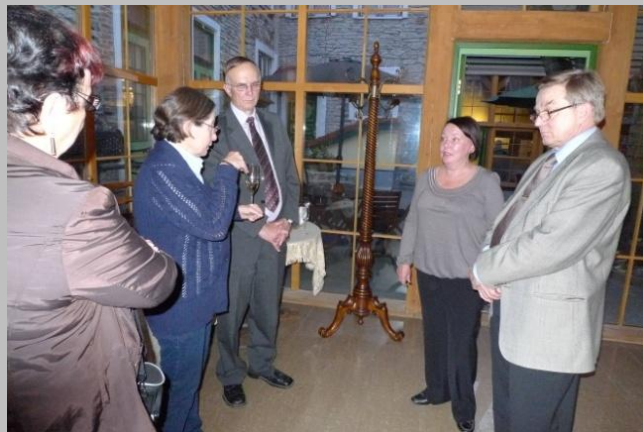
Keskustelua esityksen jälkeen