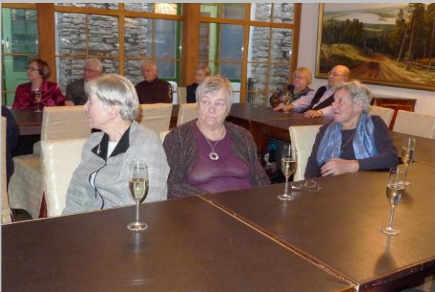
Tervetuliaismaljat hotellin meeting roomissa