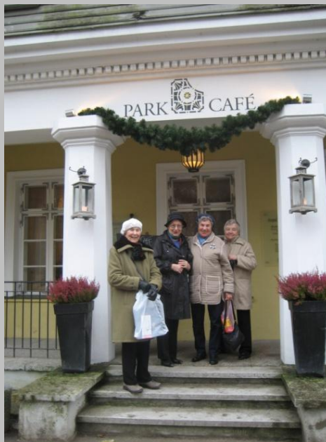
Iskujoukko tulossa Kadriorgin puiston laidan Park Cafeesta