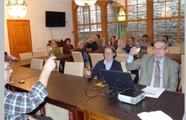
Tervetuliaismaljat hotellin meeting roomissa