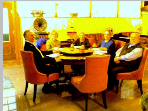
Hallitus piti kokousta