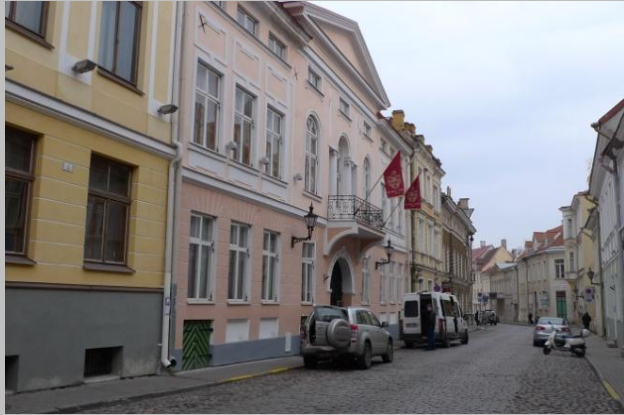
Hotelli Lai -kadulla